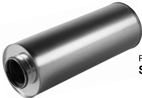
Ronde geluiddemper SCA